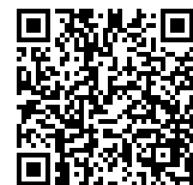
データベースモデルタイトルリスト

2024年1月より、STMコレクション（理工医分野 約830タイトル）から データベースモデル（全分野 約1,370タイトル）へ変更 になります。およそ1997年～最新号までフルテキスト利用可能です。