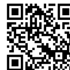
【OPACカテゴリ検索 新着図書】

【新着図書の検索】OPACの カテゴリ検索 > 新着図書 で一覧（最新2週間）、 あるいは、 詳細検索画面 で新着〇日以内を指定して検索が可能です。